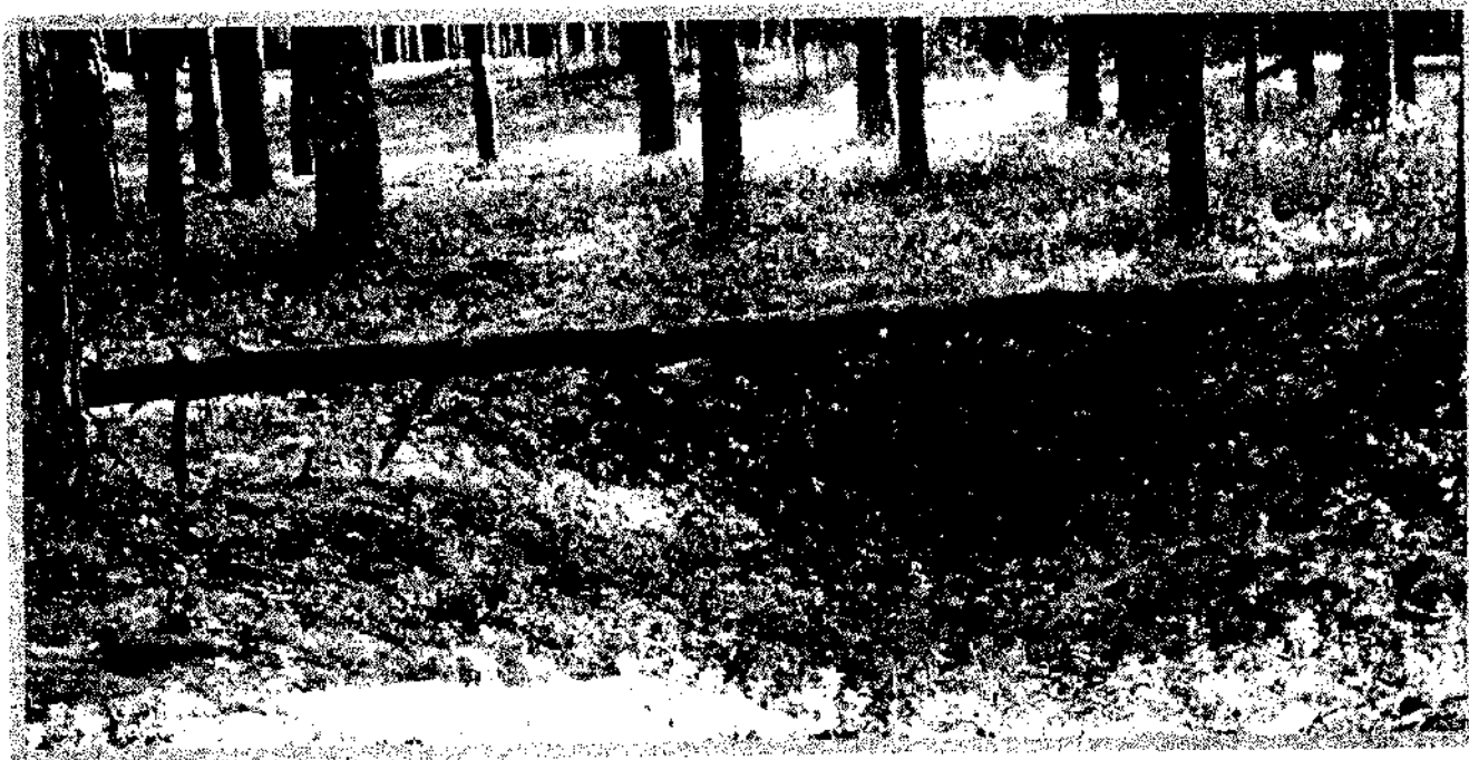
Изображение № 3 Валежник