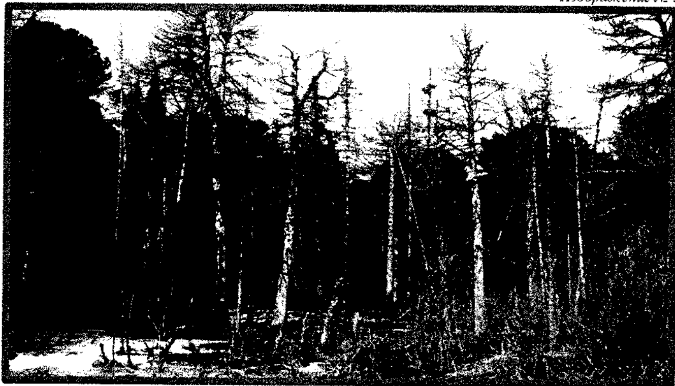
Изображение № 4 Сухостойное дерево. Не является валежником Изображение № 5

Кроме того, необходимо обратить внимание, что деревья, которые лежат на земле, но не имеют признаков естественного отмирания (имеют зеленую листву или хвою), определять как «мертвые» не допускается (смотри изображение № 5).