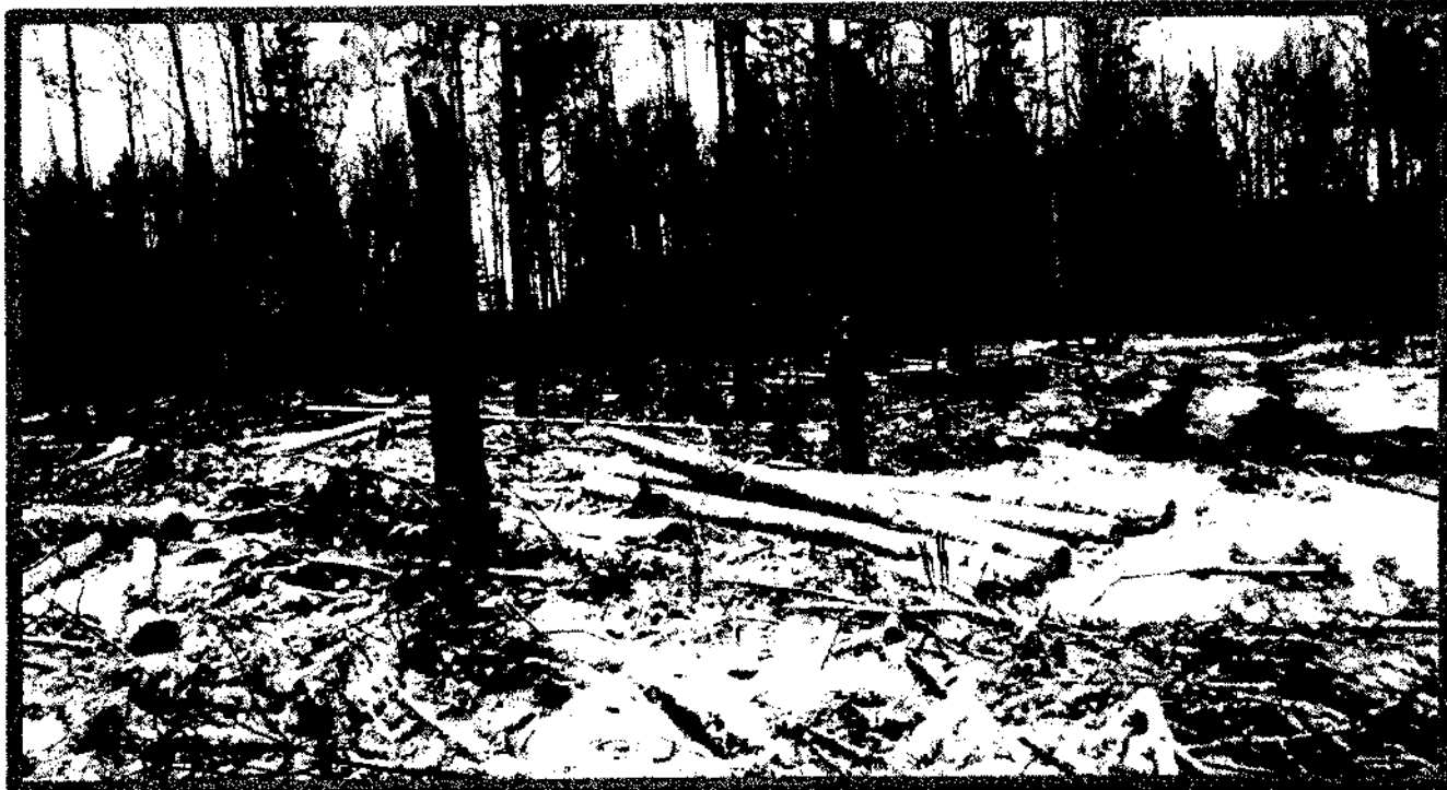
Изображение № 7 Брошенная древесина вдоль лесовозных дорог. Не является валежником