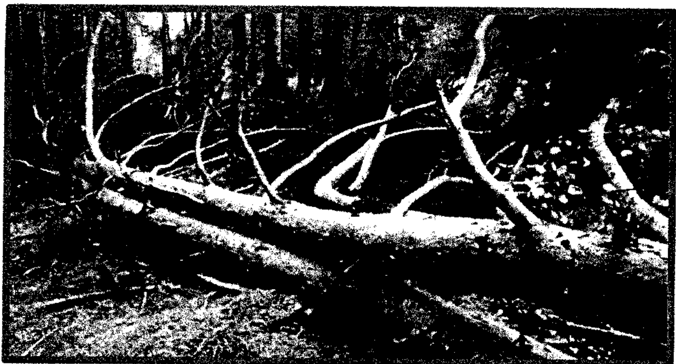
Лежащее на поверхности земли ветровальное дерево, не имеющее признаков отмирания. Не является валежником

Кроме того, необходимо обратить внимание, что деревья, которые лежат на земле, но не имеют признаков естественного отмирания (имеют зеленую листву или хвою), определять как «мертвые» не допускается (смотри изображение № 5).